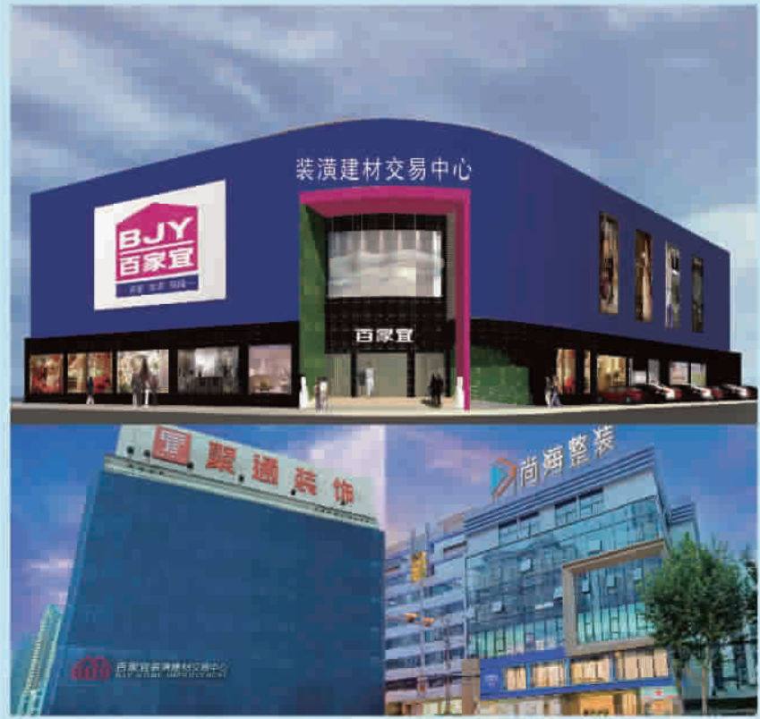
聚通装饰集团拥有三家建材选购城,实景出样,厂商导购,让您兜兜转转,一站满足所有家装需求。

聚通装饰集团对入驻的每一户商家都经过了标准化体系的考察遴选,并结合上海市装饰装修协会的多年认证指标数据,无投诉等原则,建立材料评审和严格准入机制,全部销售秉承正货优选、正品服务、正价承诺的“三正”原则,向消费者承诺假一罚十、贵一赔五。