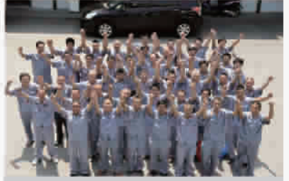
90年代不计其数的装修公司,在发包找游击队的时候,聚通就建立了自有施工队伍并十分珍惜工人,发展至今,聚通已有3000多名工人,很多工人在聚通一干就是二十年。