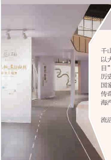
■ 学生们前来参观展览

位于二层的静态展示区展出了近200余幅丝路沿途的影像作品。通过“美美与共”、“约会吧丝路”、“诗和远方”、“我的丝路”、“丝路童心”以及“丝路桥头堡”共6个主题板块,记录了“丝路”沿途的灿烂文明、壮美景色和人文风情。该展览由中国文化管理协会主办,上海市嘉定区委宣传部和上海汽车博物馆联合主办,将持续至4月14日。 本报记者 华心怡