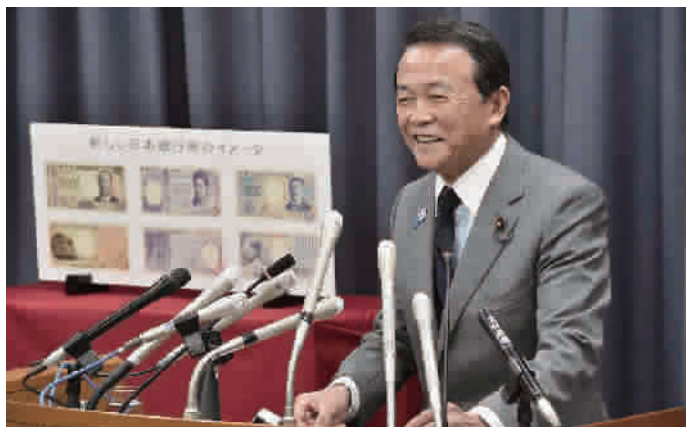
麻生太郎介绍新版日元纸币