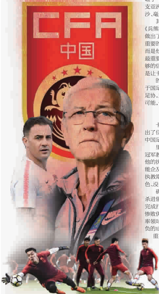
新民图表 制图 戴佳嘉

对曼联球迷而言，唯一的安慰是其他豪门近期也不争气，红魔在积分榜上没被甩开，36轮打完，只落后第四名的切尔西3分。既然如此，不如选择继续信任索尔斯基亚，要知道他没有一个转会窗，也没有3.5亿英镑的预算，能坚持到现在已经不容易了，至于他对曼联的改造，为什么不能等上一两个赛季，看看更衣室里的发胶会否消失？ 本报记者 金雷