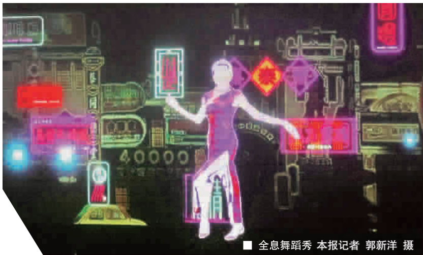
全息舞蹈秀