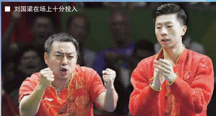
■ 刘国梁在场上十分投入