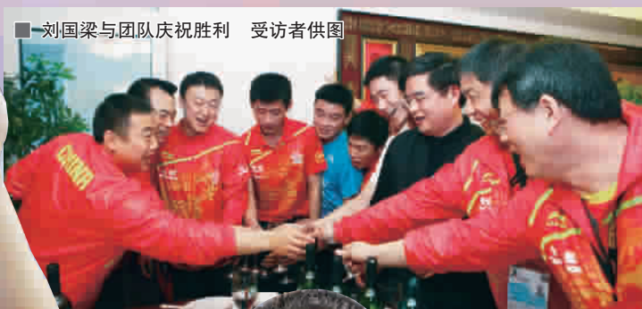
■ 刘国梁与团队庆祝胜利 受访者供图