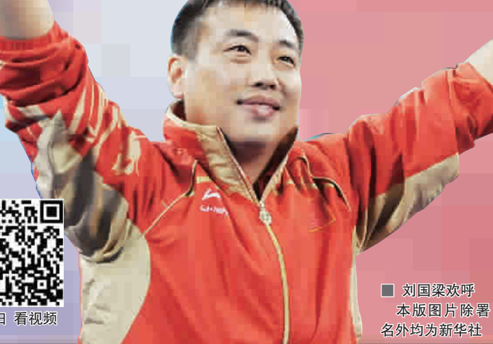
■ 刘国梁欢呼