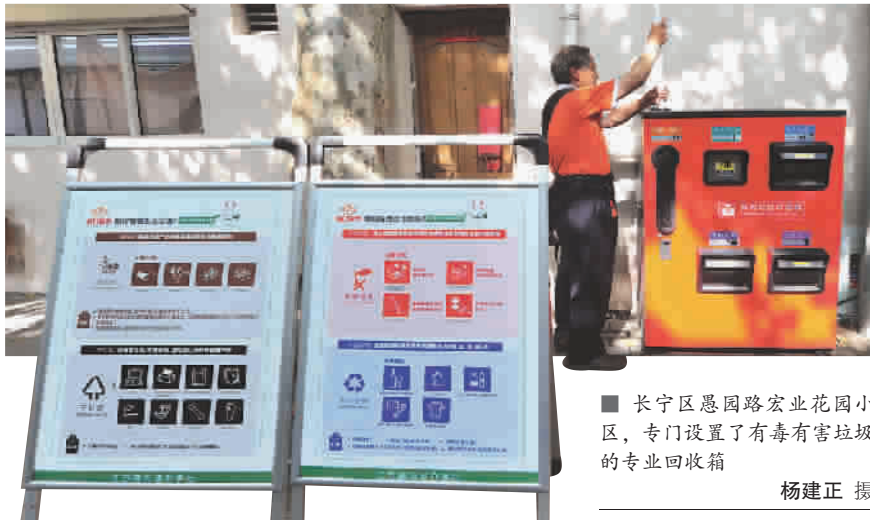
■长宁区愚园路宏业花园小区,专门设置了有毒有害垃圾的专业回收箱

三是营造社会氛围,促进习惯养成。通过“面对面”告知,完成全市800余万户市民入户宣传,落实垃圾处理设施公众开放日制度。全方位引导社会参与,扩大垃圾分类志愿者、社会监督员队伍规模。