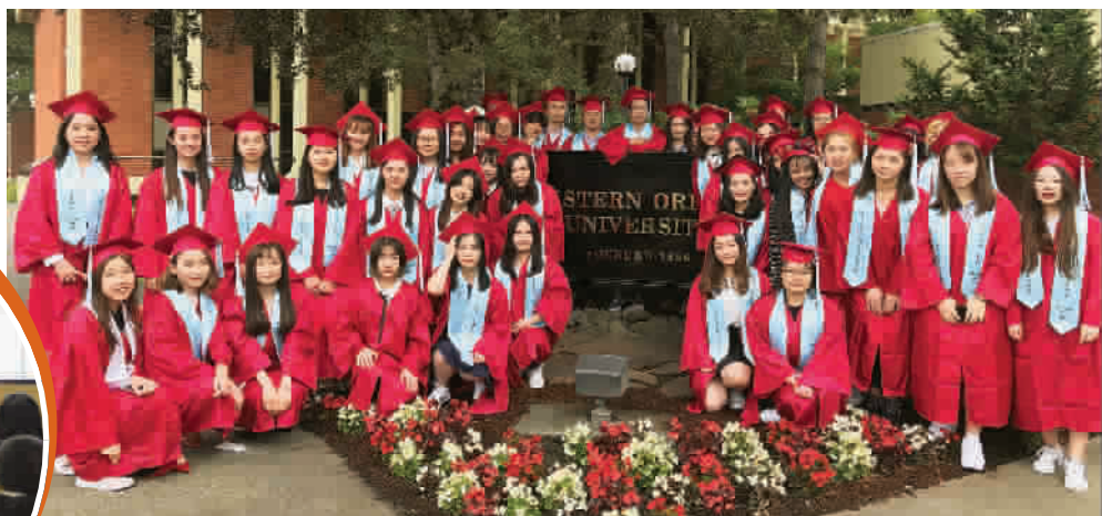
▲ 学前教育专业学生在西俄勒冈大学获得学位

国外合作高校,深入了解对方的优势及专业特点。在确定合作伙伴时,既要求对方的专业具有靠前的学术排名和行业认可度,也更加青睐具有深厚历史人文底蕴的百年老校。不仅希望在专业建设上向对方借力,也希望在通识教育、人文素养、创新思维方面感染和带动天华学生综合能力的全面提升。