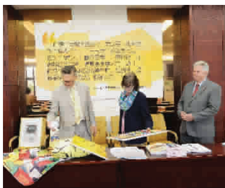
▲ 阿拉巴马大学教育学院彼得院长赞赏天华学院活力课堂教学改革

罗马并非一日建成。这份出色答卷的背后,是天华学院十多年来坚持国际化办学的育才之路。