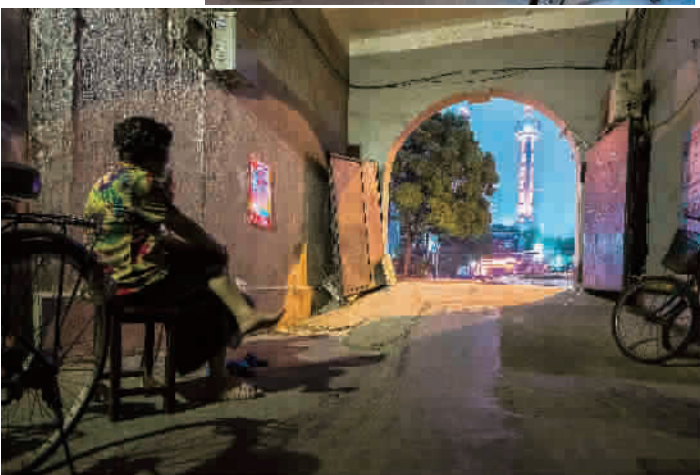
东大名路（摄于2017年6月）