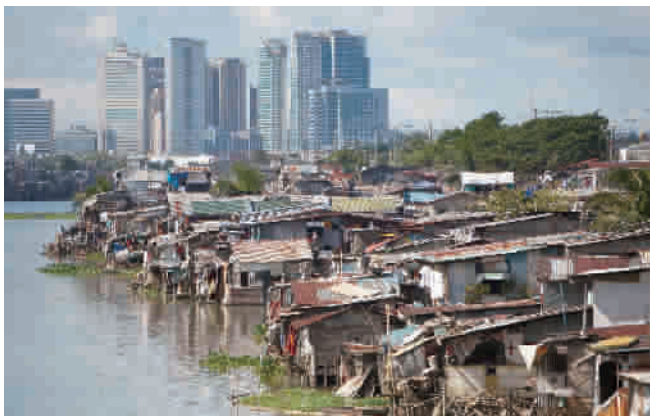
贫民区与富人区对比明显