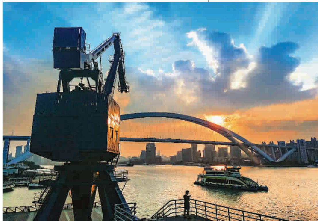
夕阳西下的浦江景色,浦东滨江的工业遗存为水晶天增添了城市文化的厚重感