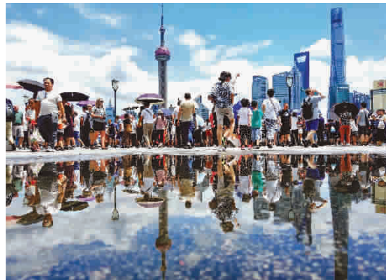
浦江两岸在蓝天白云的映衬下充满了大都市的盎然生机,水中倒映出水晶天