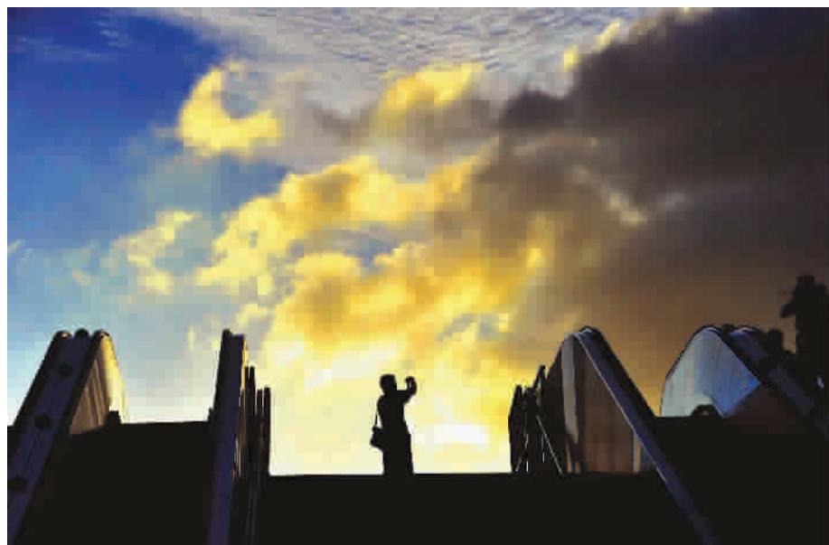
水晶天夹带着高积云,让中城的天际充满了新奇的变幻