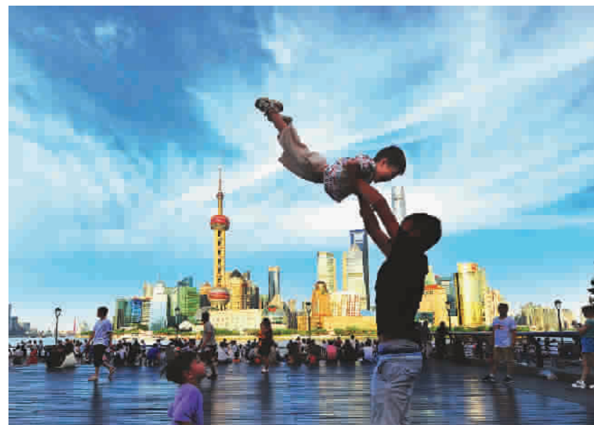
游客父子在蓝天白云下尽享亲情与欢乐