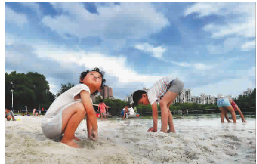
蓝天白云下的大宁郁金香公园充满人与自然融合的魅力,孩子们在白沙滩上玩沙嬉戏