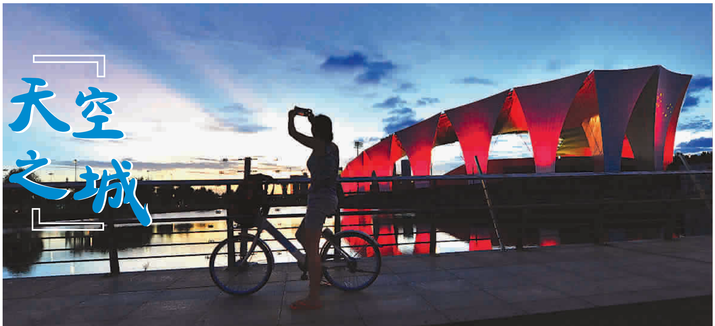
夜幕降临,月亮湾的“海上王冠”与云霞交融一体,诗情画意尽在其中