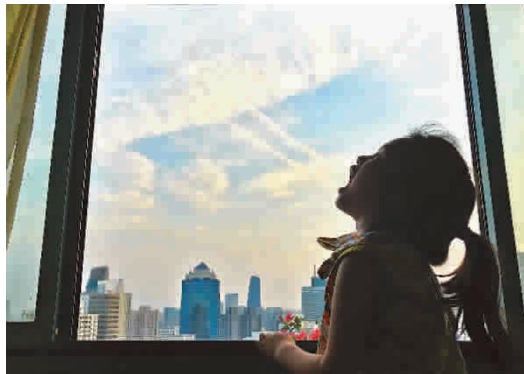
调皮的小姑娘爱拍“错位照”,张开嘴便能吐出一长串云