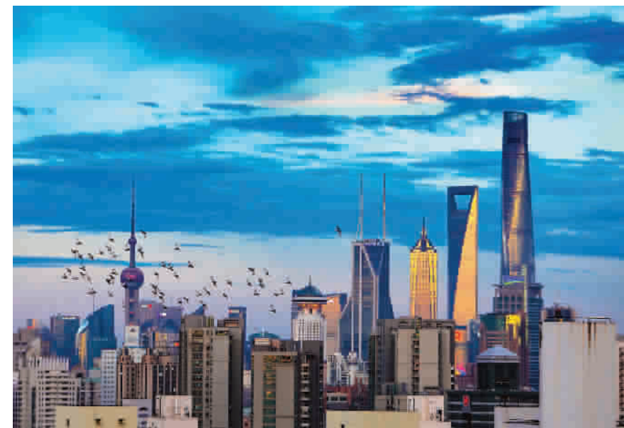
陆家嘴的高楼反射着落日的余晖,鸽子在空中盘旋,仿佛也在留恋这难得的美景