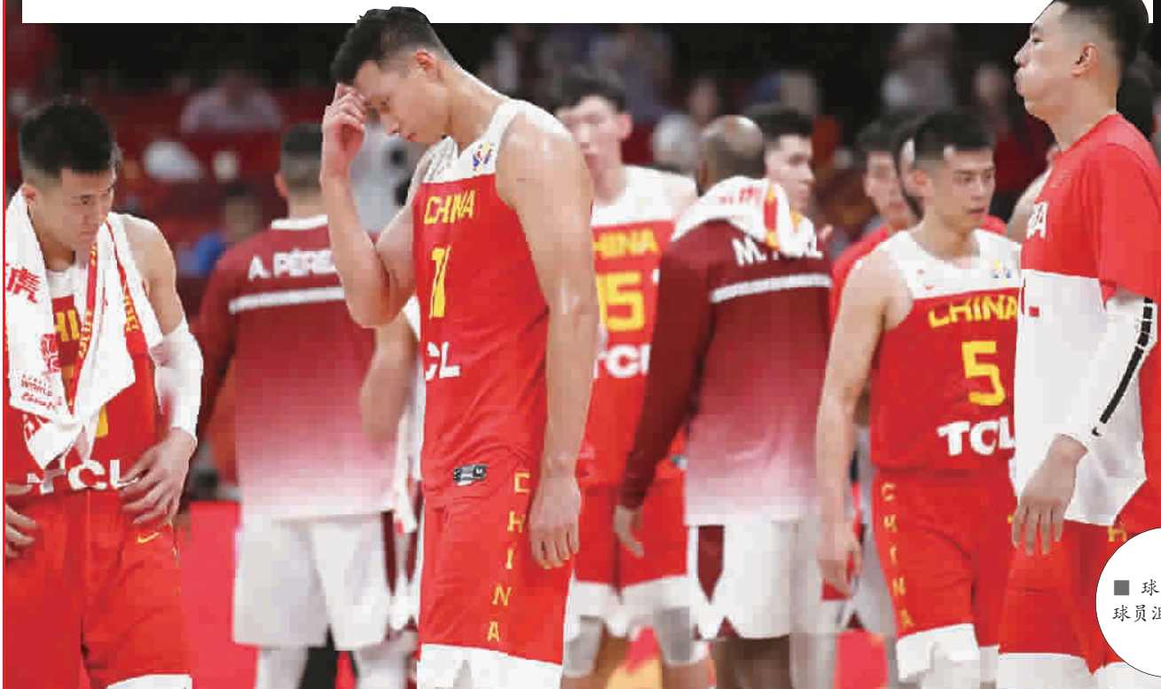
球队崩盘， 球员沮丧