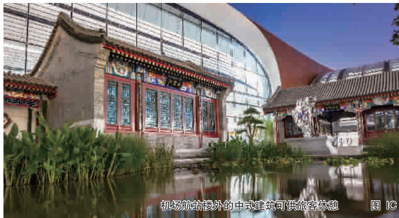
机场航站楼外的中式建筑可供旅客休憩 图 IC