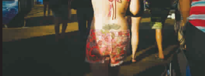
光与暗 摄于美国圣莫妮卡(2014年)