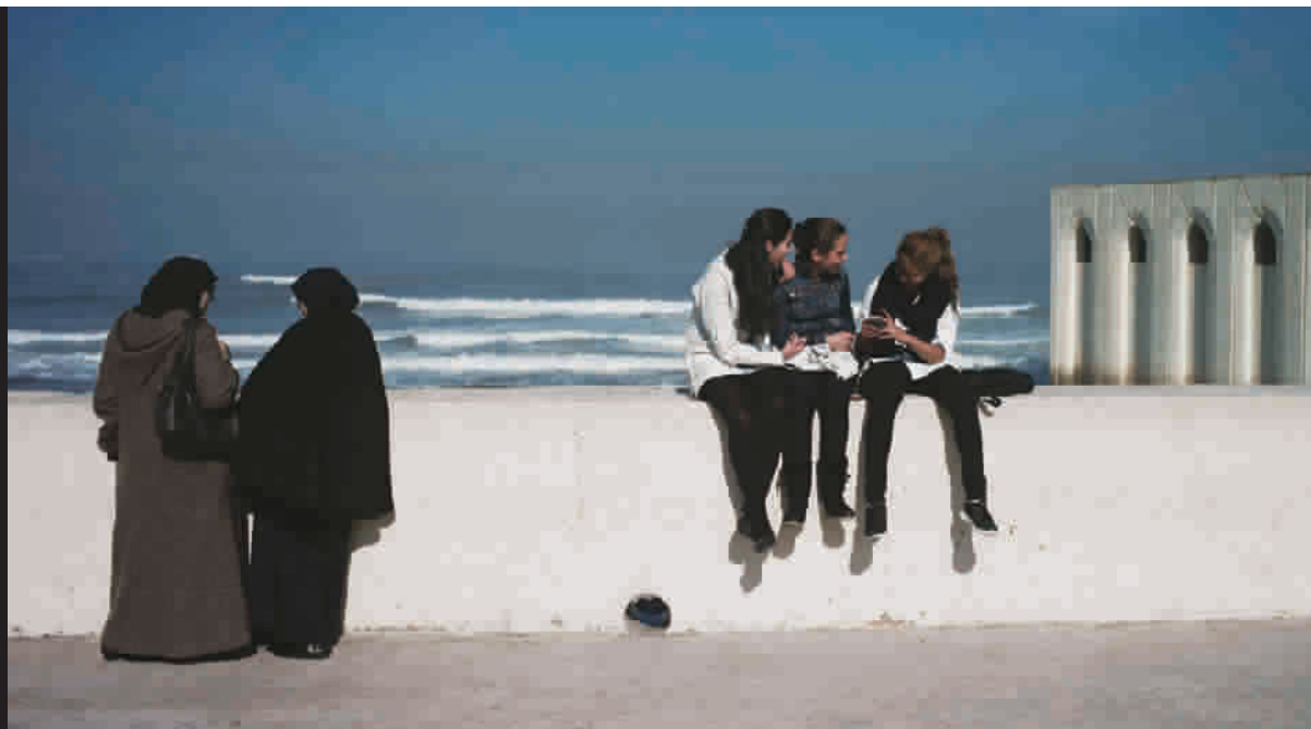
眼中的风景与生活的背景 摄于摩洛哥卡萨布兰卡(2014年)