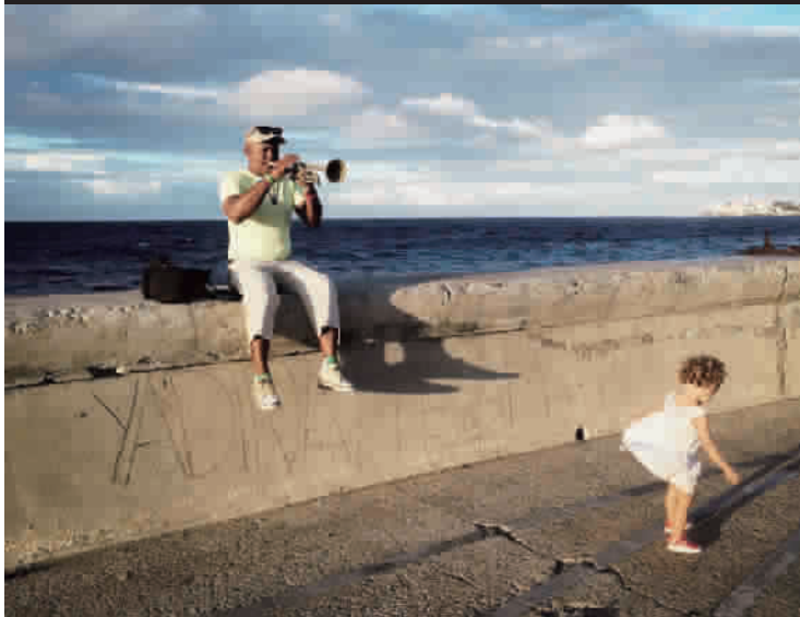
人生 摄于古巴哈瓦那(2016年)