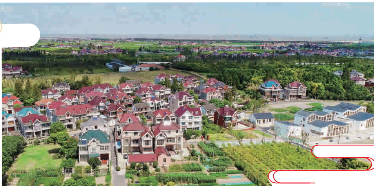
塘湾村正在打造有颜值的生态村