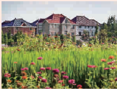
以花为媒的花红村