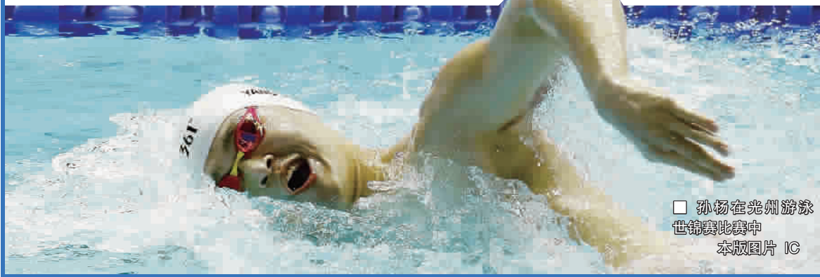
孙杨在光州游泳世锦赛比赛中

2018年11月19日,国际泳联就此事在瑞士洛桑举行听证会。2019年1月3日,国际泳联反兴奋剂委员会作出裁决:IDTM此次执行的兴奋剂检查无效,孙杨没有兴奋剂违规行为。今年3月12日,世界反兴奋剂机构(WADA)就“孙杨暴力抗检”一事正式上诉至国际体育仲裁法庭。孙杨及其律师团队于7月19日发表声明“要求CAS举行听证会时向公众开放,以求公开透明,证明自己的清白。”