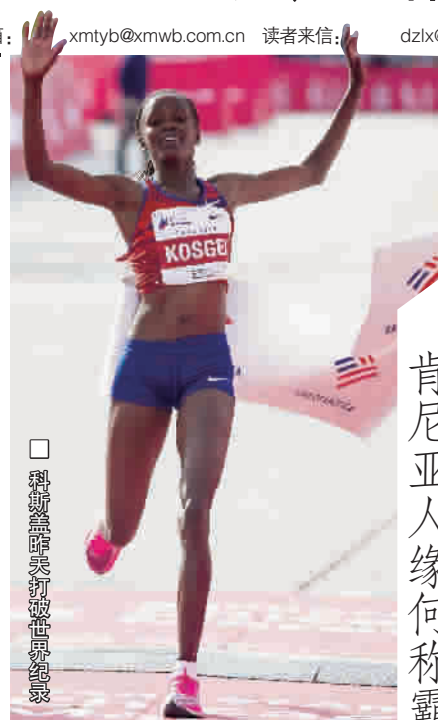
肯尼亚人缘何称霸马拉松