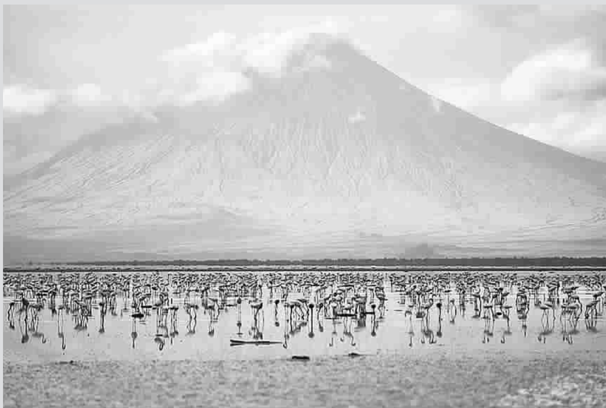
山水为动物提供了美丽丰饶的栖息地,动物是山水中的精灵,为山水增色不少。图片中的纳特隆湖是坦桑尼亚伦盖伊火山下的盐湖,是火烈鸟的重要栖息地。