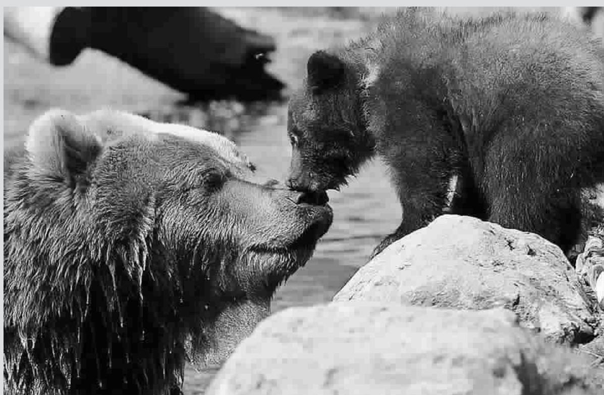
动物也有亲情,尤其是雌性动物和它的幼崽们相处得十分和谐。图为一头棕熊妈妈和她的熊崽。

在美丽的大自然中,每天都会上演许多动人的故事,其中只有很少一部分被人类观看到。而那些扛着“长枪短炮”在大自然中“潜伏”的摄影师们,就充当了我们观看自然的“眼睛”。正是有了他们耐心的坚守,才让我们能够欣赏到发生在自然界中的那些精彩瞬间。最近,国外一些媒体评选出了“2011年度最佳自然摄影”作品,有50幅作品入选,我们选取部分作品来共同欣赏。安娜