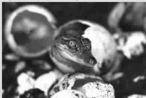
2011年11月,在老挝动物园,大约20只小暹罗鳄孵化出来,它们会在长到1岁后被放到夜晚。由于人们大肆捕杀鳄鱼制造皮革制品,野生鳄鱼越来越稀少,环保组织不得不人工饲养小鳄鱼然后放到野外。