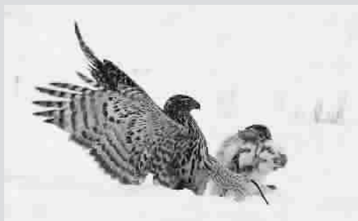
猎食与逃亡的大戏一直在自然界中上演着。在哈萨克斯坦的茫茫雪原上,一只兔子最终未能逃脱老鹰的“魔爪”。