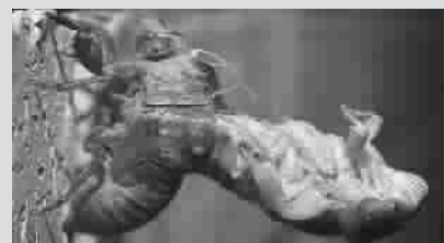
许多带壳的动物一生会有脱壳的过程,但是我们很难得一见。图为一只知了从老壳中脱离出来。