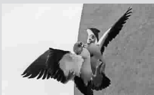
动物认得自己吗?科学家设计了很多试验也没有明确的结论。图片中这只埃及雁显然把伦敦街头一处雕塑镜面中自己的影像当成了竞争对手,反复而猛烈地攻击那个幻影。