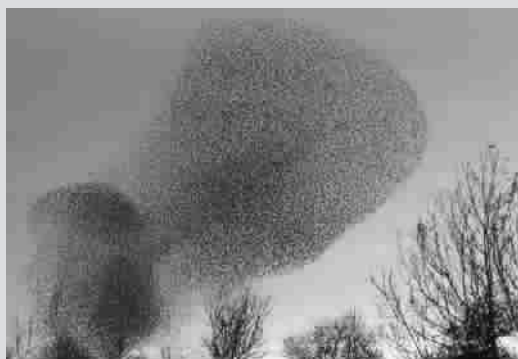
棕鸟是世界上最喜欢集群的鸟儿,它们常常数以千计地聚集起来,形成各种各样的鸟群图案。图为英国苏格兰格雷提纳小镇附近拍摄到的棕鸟群。