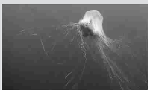
出现在英国法恩群岛附近海域的狮鬃水母。它是世界上体型最大的水母,伞形躯体的直径可达2米,触须可长达35米。