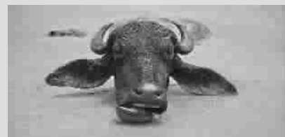
热浪袭击印度克什米尔地区,一头水牛在长满绿藻的池塘里歇凉,只露出一个大大的牛头。