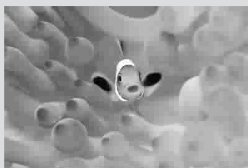
印度尼西亚附近的海域有许多漂亮的热带海洋生物。图为珊瑚丛中的小丑鱼。