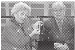
著名电影表演艺术家谢芳和她的老伴儿、著名歌剧艺术家张目珍藏一对“龙凤生肖纪念黄金表”

表盘周边采用鼎级“雪花镶嵌”技法镶嵌 262 颗宝石，粒粒钻石比邻排列，奢华无比，由数十年镶嵌经验、手艺精湛的工艺师，在高倍放大镜下操作完成，而表冠上的 90 颗天然真钻，流光溢彩，尊贵奢华、摄人心魄。