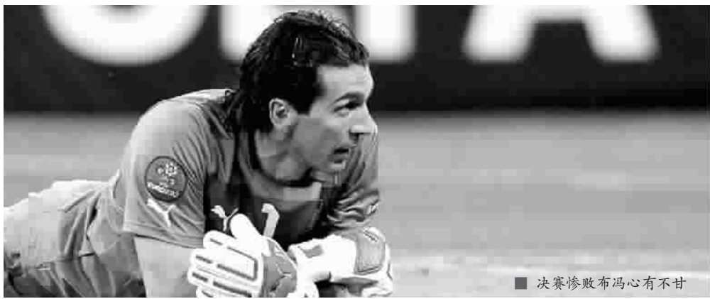
决赛惨败布冯心有不甘

布冯的十指关，今晨如此之脆弱。然而，他恰恰是更衣室里，唯一一位没有落泪的球员，也是混合采访区内唯一接受两轮采访的人。