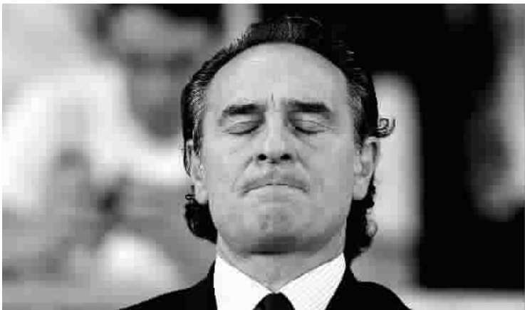
普兰德利，意大利队需要你