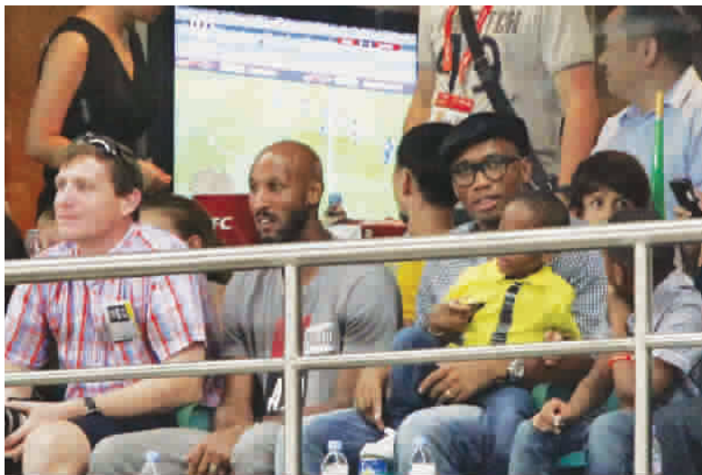
戴着鸭舌帽的德罗巴和阿内尔卡在包厢内观战