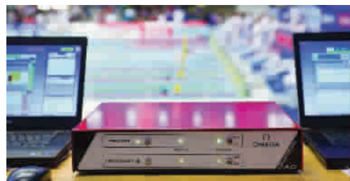
新的计时器太精确了 图 刁

“游泳排名指示灯”设备主要为观众设计。有了这种设备, 观众就无需通过主计分板确认比赛结果, 在泳池赛道终点处便可清楚得知比赛的前三名选手。