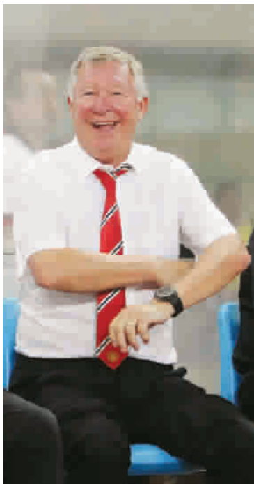
火爆场面令弗格森十分兴奋

久违了! 昨晚的上海体育场, 涌入了42000余名观众, 这样的场景, 已是十多年未见。近年来被称作商业足球比赛“票房毒药”的上海球市, 因为曼联的到来而被重新定义。