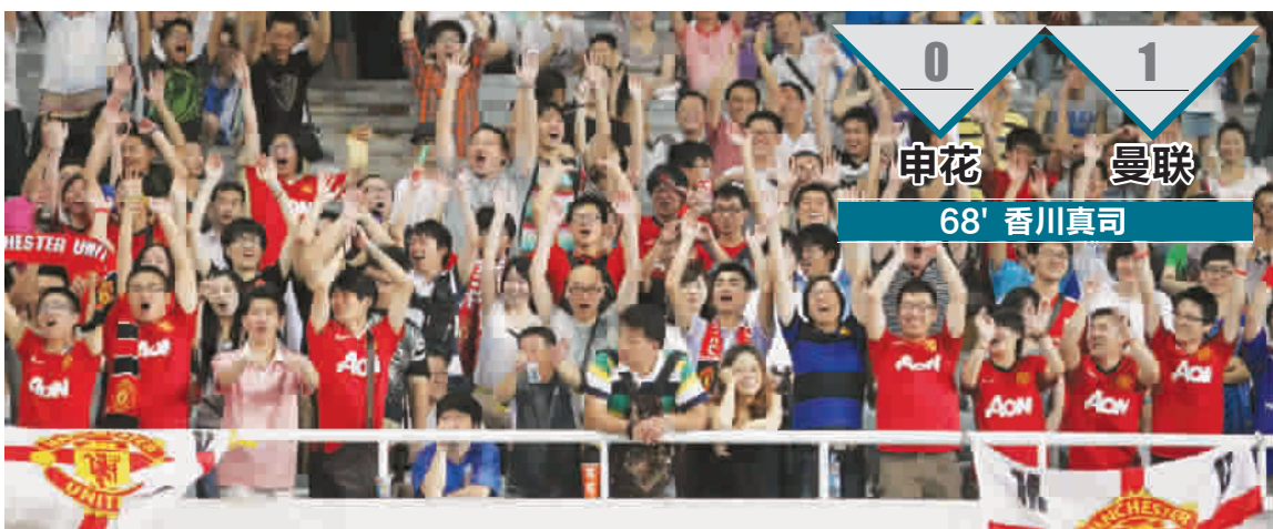
逾4万名球迷昨晚涌进上海体育场