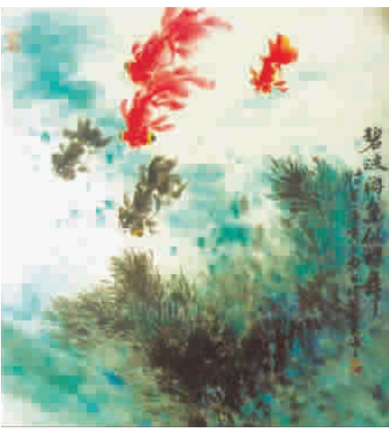
鱼似蝶舞 (中国画) 屠功明