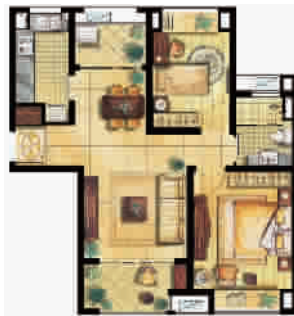
约 83 平米两房户型图

此次, 绿地新堤香公馆推出的是 76—88 平方米的两房户型。在空间的运用上, “新堤香公馆”设计了 13 平方米的超大客厅以及 12 平方米的主卧。另外在入口玄关旁还设计了一个贮藏空间便于住户放置一些杂物。使得整个生活空间变得更加整洁舒适。