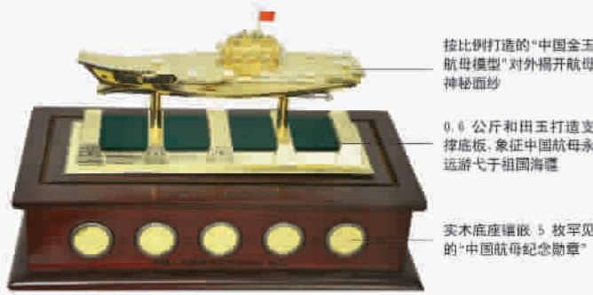
按比例打造的“中国金玉航母模型”对外揭开航母神秘面纱

和田玉“中国航母宝玺”,每套配有权威单位出具的《出品证书》、总设计师郭春宁和雕刻大师顾峰签名的《创作证书》、国家金银制品质量监督检验中心出具的《鉴定证书》,限量发行2012套,发行价:9900元/套 全国免费热线:400-001-8977 ■上海徐汇区南丹东路265号新华书店一楼 收藏热线:021-33663569 ■上海书城三楼文化生活馆 收藏热线:021-33662589