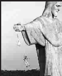
▲ 鲍姆加特纳在克罗地亚亚跳向黑 上完成低空极限跳伞 色山洞 鲍姆加特纳在克罗地亚亚跳向黑 本张图片一 色山洞 鲍姆加特纳在克罗地亚亚跳向黑 上完成低空极限跳伞

数百万人前天通过转播观看了鲍姆加特纳从3.9万米高空纵身一跃,超音速自由降落的壮举。他们中的许多人以前根本没有听说过鲍姆加特纳这个名字,这是鲍姆加特纳迄今2600多次极限特技跳伞中最震撼人心的一次。