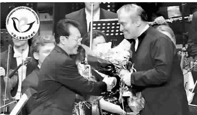
张继钢与捷杰耶夫互致祝贺

在历届艺术节的舞台上,张继钢先后有亲自创作执导的杂技芭蕾《东方天鹅》、舞蹈《千手观音》、舞剧《千手观音》《野斑马》《八桂大歌》《一把酸枣》、音乐剧《白莲》、京剧《赤壁》等8部作品参演,是参演艺术节作品最多的艺术家。早在1999年的首届艺术节,捷杰耶夫就率马林斯基剧院的芭蕾舞团、交响乐团和合唱团来沪参演,昨晚更是今年第二次来沪登台,上海乐迷还亲切地给他封了个“姐夫”的称号。两位艺术家都在艺术节的舞台上,为促进中外文化交流做出了积极的贡献。在授奖时,两人的感言中都表示:“期待着今