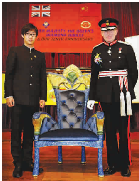
英国女王钻禧庆典之际，施君将“传世珐琅女王御座”赠给了王室代表