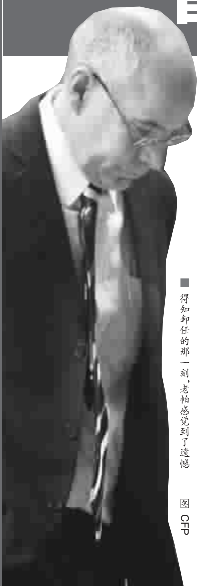
得知卸任的那一刻,老帕感觉到了遗憾