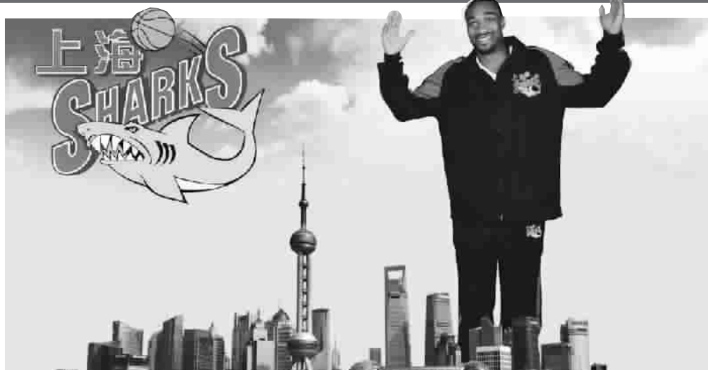
阿里纳斯初来上海,曾让球迷充满美好的遐想 图 C