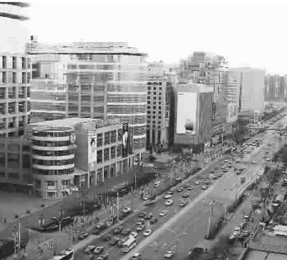
雾锁前后 北京街景迥异

环保部昨天公布的重点城市空气质量日报显示,不包括PM2.5和臭氧的API污染指数最高的前10位城市:第一位是石家庄,第二位邯郸,第三位保定,第四位唐山,第五位天津,第六位郑州,第七位济南,第八位秦皇岛,第九位济宁,乌鲁木齐和武汉并列第十位。