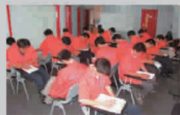
统帅装饰水电工参加严格考试