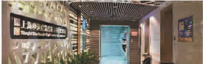
申远总部管理中心、申远工装公司及居然饰家整体软装公司内景一瞥