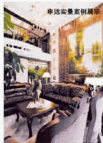
申远实景案例展示

配合为模式,以有求必应承诺,以“快速、主动、专业”为特色,为业主做好售后服务的保障工作。