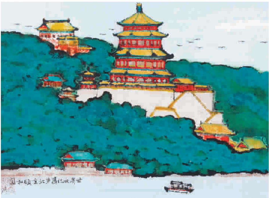
颐和行宫说清代,虽由人工宛天开。 历史雷声已消逝,博物公园山水美。 《颐和园》陈家冷

据悉,至2012年7月,中国先后被批准列入《世界遗产名录》的世界遗产有43处。保护世界遗产,就是尊重历史,保护人类文明和人类赖以生存的环境。