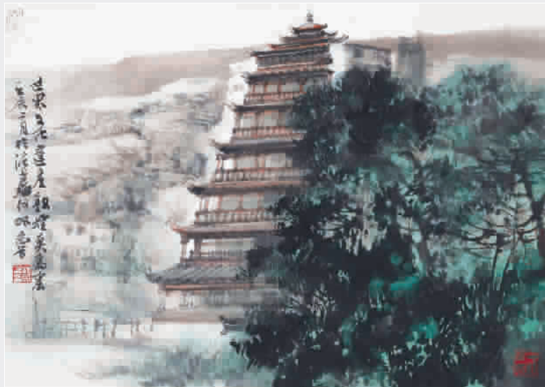
石窟龛室始前秦,壁画彩塑存至今。 别有洞天千佛像,沙漠绿洲艺术林。 《莫高窟》汪家芳