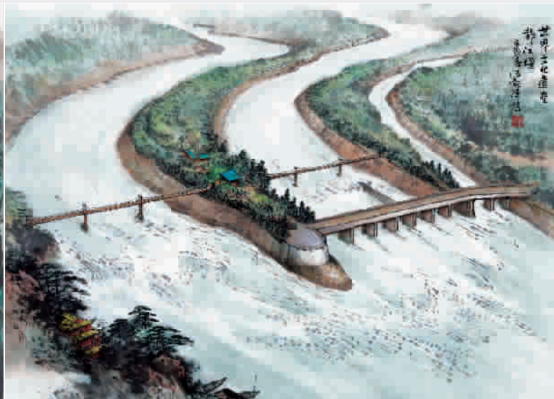
李冰率众克万难,成就天府好文章。 我等拜水都江堰,探幽问道青城山。