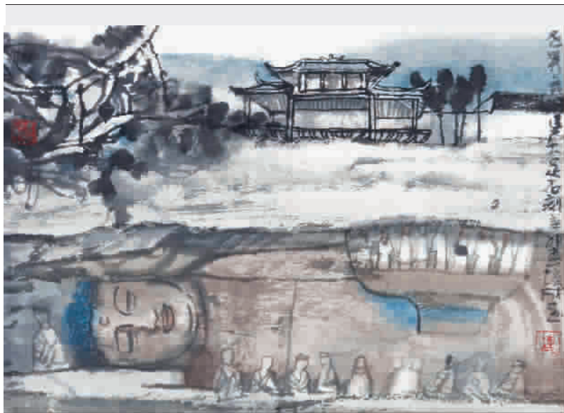
唐宋明月照雾都,摩崖石刻佛为主。 宝顶北山四海闻,大足走通五洲路。 《大足石刻》张培成