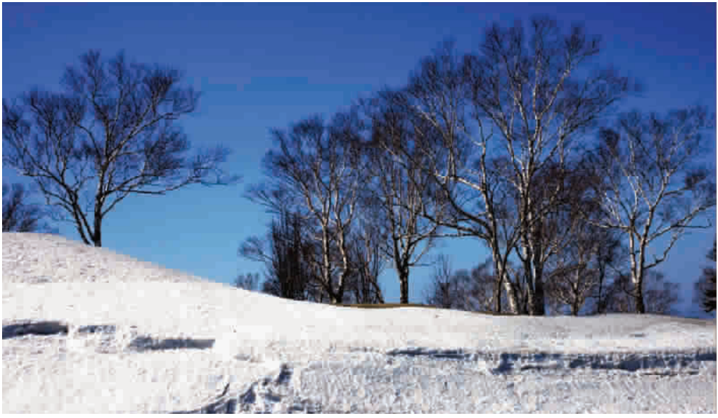
■ 雪后拾景