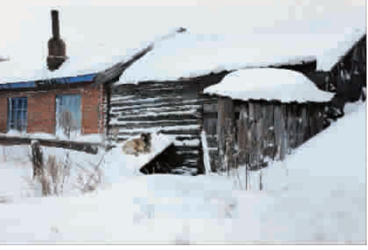
■ 长春雪乡