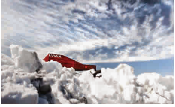
■ 风雪庇护所