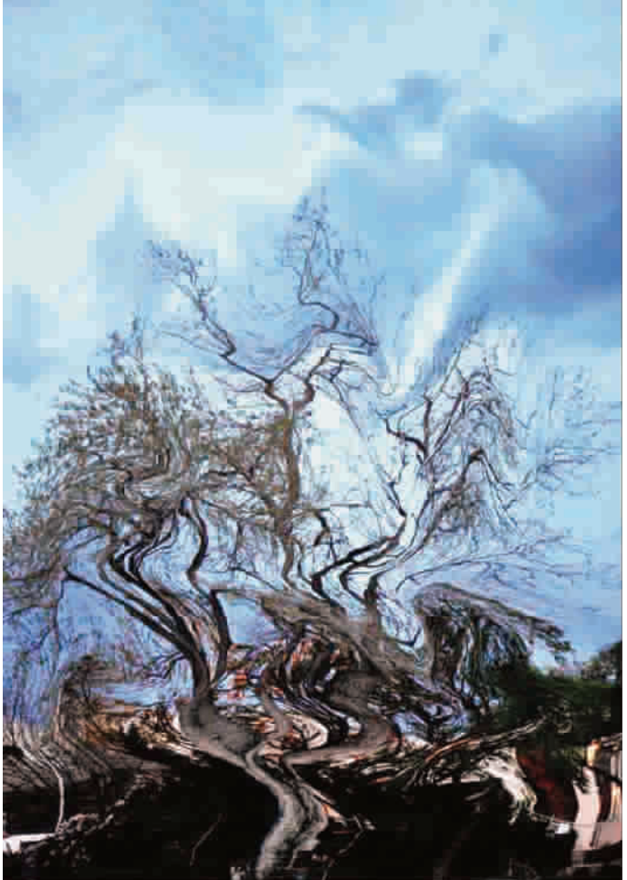
■ 福地凡树亦妖娆

生命的意义。灾难过去了，但人们心中的伤痛可能需要很久才能愈合，用这样的美景既追思逝者，又更多地安抚了仍然坚强活着的人。这景象让我立刻想起了同样遭遇的汶川和玉树，真想让那里的人们也看一看这烟花，和这美雪。 无论冬天多么漫长寒冷，它总是会过去的。而过去并不代表消失，哪怕是年年大雪的地方，每一年的那抹白色都是独一无二的，因为它们烙印在每个人的回忆和经历之中，哪怕一生都想不起来，却仍然存在着。 晓依