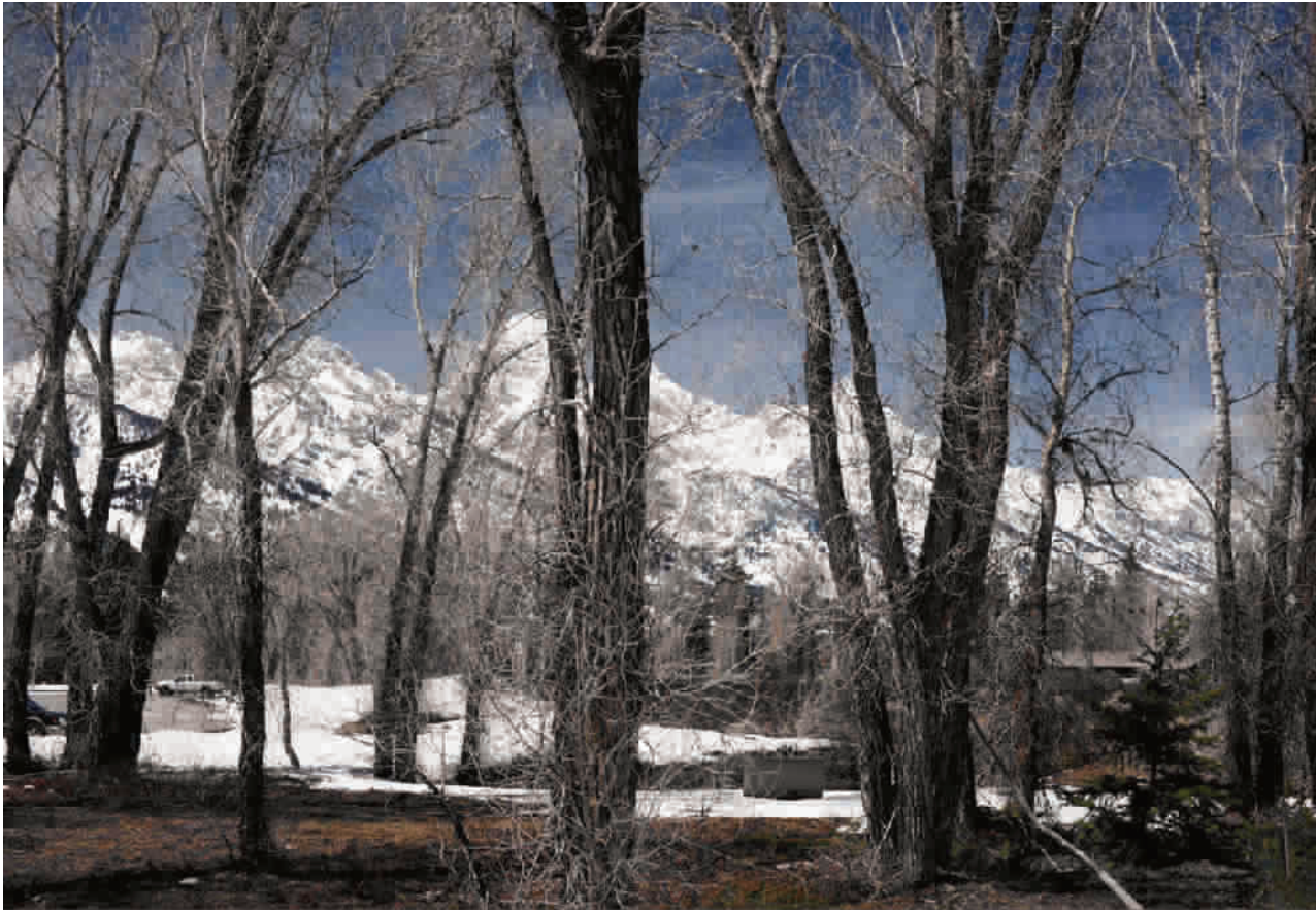
■ 峻朗之躯