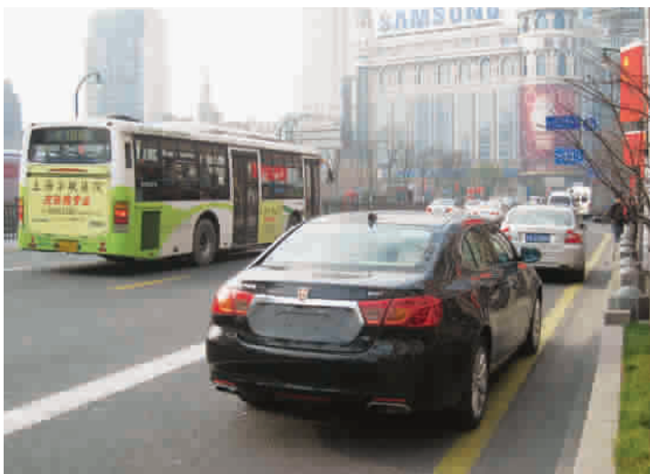
■ 公交专用道被私家车占用

在车站上候车的乘客告诉记者,这种情况每天存在,工作日的晚高峰时间,社会车辆随意占道的情况更为明显,导致公交车进站时间拉长,加