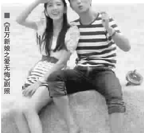
■《百万新娘之爱无悔》剧照

本报讯(记者孙佳音)都市情感剧《百万新娘之爱无悔》明天亮相湖南卫视金鹰剧场,该剧由金牌编剧兼制作人简远信操刀。对于时下大陆荧屏婆妈剧泛滥的现象,这位台湾金牌制作人坦言:剧情的核心应该是爱,而不是流于表面的家斗。