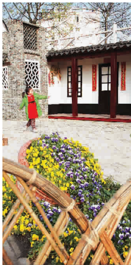
■ 竹篱笆、青砖墙，《江南水乡》温馨恬静