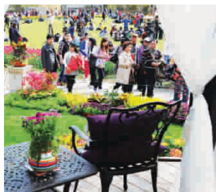
■ 欧陆风情的《生活的院子》，魅力十足