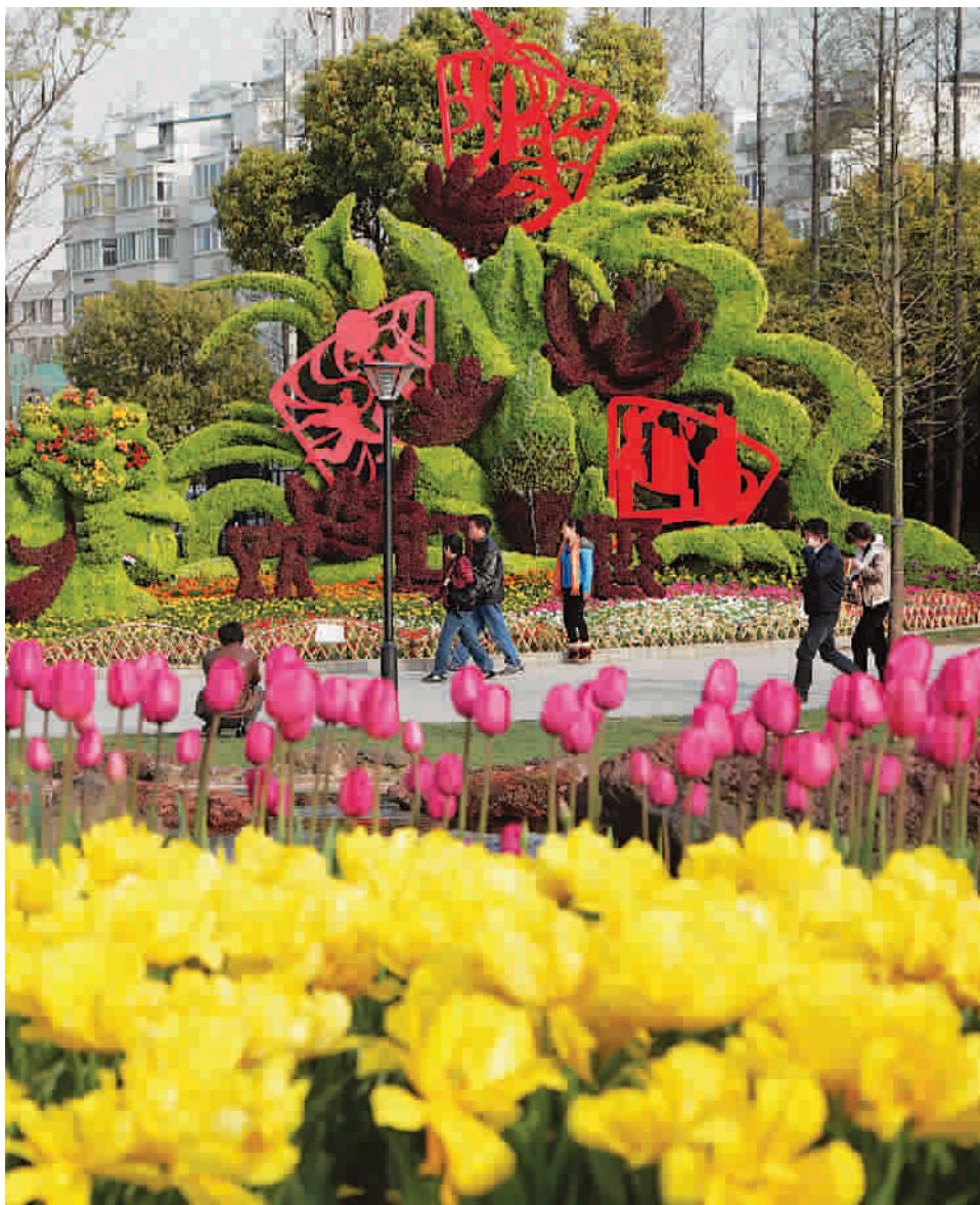
■ 主题景点《欢迎》矗立在公园大门旁

花开展展之时，正是球根花卉盛开之时。球根花卉除了郁金香、洋水仙、葡萄风信子外，还增加了风信子、花毛茛、大花葱、球根鸢尾、银莲花等特色品种，使球根花卉的观赏期从3月中旬延长到5月上旬。