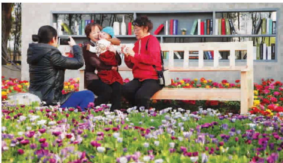
■ 《花园书吧》是家人休闲好地方