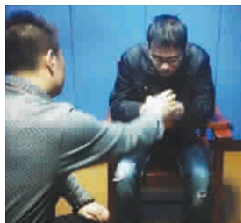
■ 犯罪嫌疑人接受询问

事发后,民警、特警赶到现场处置。尽管事发时正值中午,但学校后门平时无学生进出,因此无人在事件中受伤。 本报记者 左妍