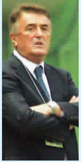
■ 山东鲁能请来了与米卢齐名的主帅安蒂奇,效果不错