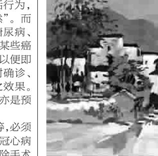
西递 (水粉画) 顾惠忠

疗卫生服务的基本政策。国家关注民生,“健康中国2020”的提出便是明证。我国的医疗卫生服务重视全科医学与社区卫生服务,将社区卫生服务作为民众健康的“守护者”,当是民众的福音。