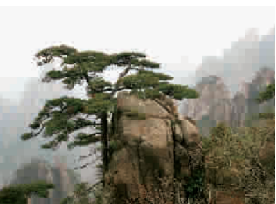
程传琼黄山松摄影作品选