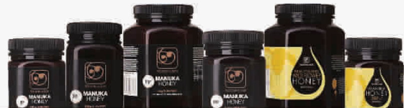
销售专柜:久光百货B1楼、正大广场B2楼、高岛屋百货B1楼、梅龙镇广场B1楼、汇金百货1楼、东方南汇、汇联海厦1楼、伊势丹百货B1楼、全州广场B1楼、第一八佰伴B1楼、上海第一食品商店连锁店、百联又一城B1楼 团购热线:400-118-5758 (进口沃森麦卢卡蜂蜜)

当你在享受新西兰美丽独特风光时,别忘了享受自然带给你的恩赐,浓密的香甜,混合花果香,浸润着心田,试过就不会忘记!“森蜂园”让追求纯净自然,品质生活的人们一起来分享来自新西兰的臻品——(WATSON&SON) Manuka 蜂蜜。