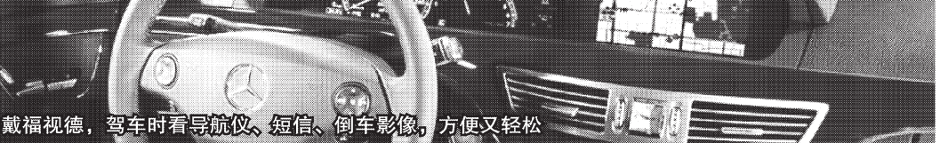
戴福视德，驾车时看导航仪、短信、倒车影像，方便又轻松

即使再苛刻的专家也承认：福视德看远、看中、看近只要一副镜，真实清晰，确实是非常理想的选择！