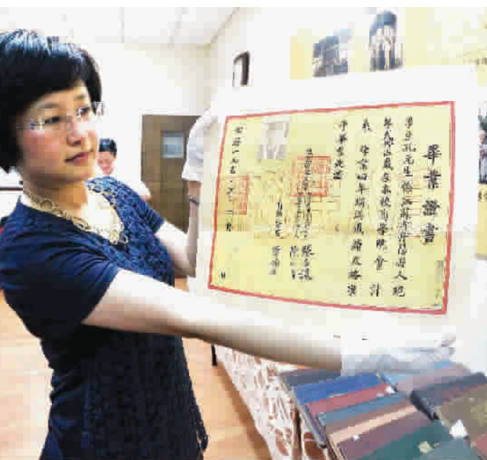
这是1950年的复旦大学毕业证书

昨天是高考首日，伴有大风暴雨。本市的89个高考考场外，随处可见陪考的家长们在大雨中静静地等候，朵朵伞花见证了感人的“父母心”。图为昨天中午，黄浦区一处高考考场外，众多的家长冒着大雨在等候考生出考场