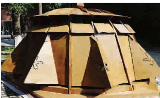
■ 像把撑开的油纸伞,如含苞待放的花朵,中学生驰骋着自己的想象力,用纸板搭建心中的建筑