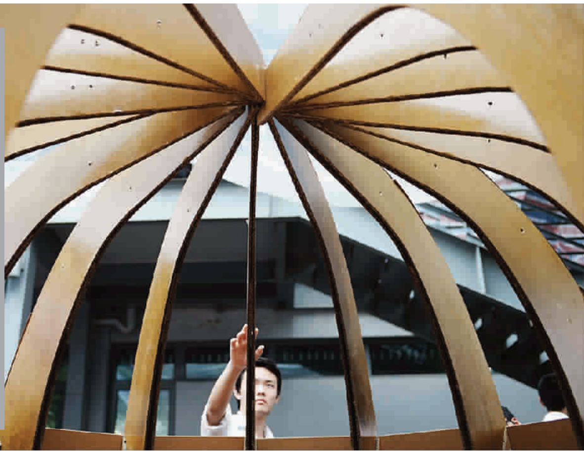
■ 让中学生参与大学生的比赛,在同济大学举行的建造节上,上海的一批优秀高中生在高考前积极参与此项赛事

又是一年高考季,今天有900余万孩子走进了高考“战场”。与往年相比,今年上海的考生人数共4.65万,比往年低了1.25万,一直相反的则是参加了美术类专业统考的人数却由5300人上升到了5700人。艺考生人数的不降反升并非说明艺术培育越来越受到重视,相反,这些数字的变化反映的却是学艺术的目的已经变质,不少家长甚至坦言,让孩子学艺术就是为了弥补文化考上的差距。艺考不该成为上大学的“捷径”!