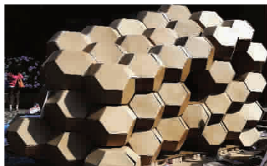
■ 中学生参与大学生的比赛,在艺术感充盈的氛围中,提升自己的审美情趣