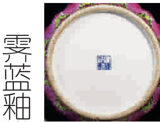
霁蓝釉描金海晏河清燕耳尊