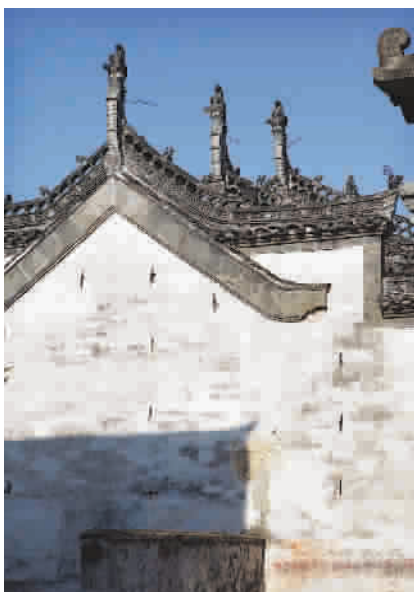
■ 高耸的马头墙、精美的砖雕，蓝天下的徽派建筑魅力十足

早在1997年，安徽就颁布了《皖南古民居保护条例》，但这里的古民居依然难以改变被“外迁”的命运。2003年，皖南休宁县黄村的古民居“荫徐堂”就被拆成700块木件、8500块砖瓦、500块石件，装进40个货柜，运到了美国波士顿北郊萨兰镇的埃塞克斯博物馆内。妥了之后，博物馆首席执行官唐·蒙罗在给休宁县的邀请信中说：“我们因荫徐堂相识、结缘，期待着在美国讨论此项目带来的其他合作和文化交流事宜，将中美之间的这种富有深意的文化合作继续下去。”文物“外漂”，有钱的问题，