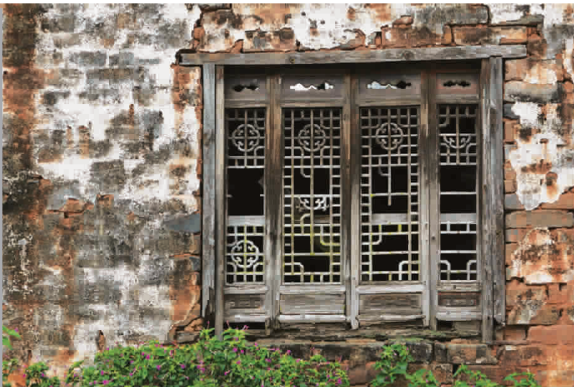
■ 斑驳的墙面诉说着沧桑的历史，透露出的更是阅尽繁华后的淡定

自从4月关于成龙将收藏的徽派古建筑捐赠新加坡的消息传出，各界对此众说纷纭，批评者有之，骂人者有之，唏嘘声更是浪头迭起。成龙一向以爱国形象示人，如今的行为也更让人震惊，受到了更多谴责。作为旁观者和古建筑艺术的爱好者，冷眼观察了两个月，在事件渐渐平息之时，想说说我的看法。