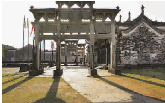
■ 都凝固成了徽州地区这种常见的石头门，每一个故事，这故事或大喜或大悲，但如今每一处牌坊的背后都是一段曲折甚至