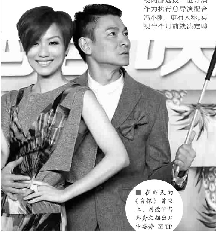
在昨天的《盲探》首映上，刘德华与郑秀文摆出片中姿势

八大唱片公司各挑五十首拥有版权歌曲进行比拼 金钟奖首推「中国音超」 本报讯(记者夏琦)电视荧屏上选秀狂潮继续，但国内的唱片工业依旧低迷。记者昨天从唯一国家级流行音乐大奖金钟奖主办方了解到，将于9月在深圳卫视开播的金钟奖将有八大唱片公司介入，组成“八大联队”比赛，形成长效的流行音乐传播与推广机制。 今年深圳卫视·金钟奖将首度引入“足球超级联赛”的形式，只不过参赛的主体是流行乐坛的八家唱片公司。这八家唱片公司将在为期三个多月的时间里通过一系列比赛与厮杀，决出最后的“中国音超”乐坛盟主和冠军王者。 在比赛过程中，每个唱片公司都将挑选公司拥有版权的50首歌曲，共同组成总共400首歌的曲库。近日深圳卫视·金钟奖“中国音超”将在北京召开新闻发布会，正式公布“中国音超”8家唱片公司及部分队员阵容。 节目负责人表示，之所以在今年引入八大唱片公司，成为比赛的主体，也正是看到中国唱片业长期处在低迷状态，尤其是在欠缺原创作品的环境下，大量的优秀作品得不到推广与传播，深圳卫视·金钟奖希望通过引入唱片公司，形成一个长效的流行音乐传播与推广机制，重建中国流行音乐的产业链条，为中国的流行音乐传播蓄力。据他透露，目前有多位早已成名的大牌歌手有意加盟“中国音超”，欲代表各大联队与歌坛新人一同比赛竞争，目前已确定的有金志文、周笔畅、陈楚生等。 另一方面，很多选秀选手在比赛时一夜成名，但在比赛后却后续乏力，虽然得奖选手并非必须和所属队伍的唱片公司签约，但通过今年的比赛进程，唱片公司和选手之间也将增进相互了解，对于选秀选手的后续开发自然也有好处。 金钟奖历年来都有很多来自专业院团的参赛者，今年又加入了更多草根元素和真人秀势力，尝试打通真人秀选手、专业院团歌手及民间草根选手的阵营，节目组负责人表示：“在中国音超，请你拿出真本领。”此前提到的金志文、周笔畅、陈楚生，均是已签约唱片公司的前选秀选手，另外从目前报名进入中国音协专家听评的名单情况来看，包括曾经参加过《中国好声音》《快乐男声》《中国梦之声》《快乐女声》《青歌赛》等几乎所有的真人秀以及主要歌唱比赛的选手，名单中更有部分正在其他节目中参加比赛的选手。