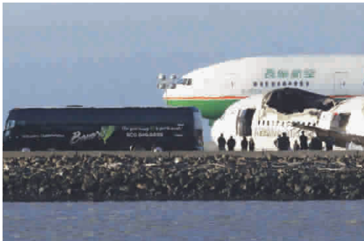
■ 幸存乘客与家属重返空难发生地

而针对飞行员在调查中称飞机自动油门系统可能出现故障,赫斯曼表示,根据黑匣子记录数据,没有任何迹象表明系统出现异常。