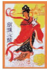
▲ 麻城火柴厂嫦娥奔月火花