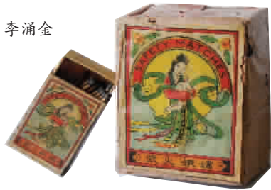
▲ 宁波正大火柴厂嫦娥奔月老火柴

嫦娥奔月火花可谓千姿百态,各种设计图案,各种绘画含义,也真符合历史流传下来的嫦娥奔月的各种各样民间传说。但无论哪种传说,都叙述一个主题,那就是嫦娥奔月倍思亲人,中秋节合家团圆。