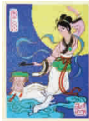
▲ 杭州火柴厂嫦娥奔月火花