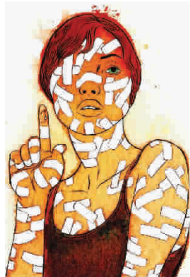
■ 创伤心伤孰个更重?