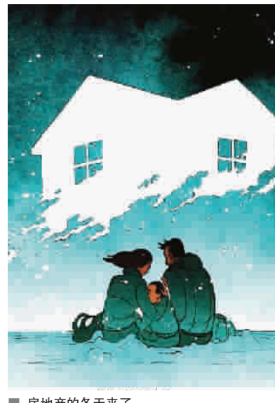
■ 房地产的冬天来了