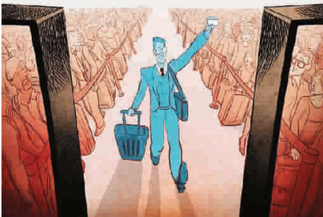
■ VIP 通道

以色列漫画家科伦·萨姆蒂,以“超现实主义”作为根基,采取象征、幻觉、奇想等语言为灵感来源的创作手法,在国际漫坛长盛不衰。艺术上,它进一步拓展了“无意识”及“主题”表述范畴,颠覆了传统漫画构想模式,促使人们对漫画特性予以重新辨识和判断。这里介绍的萨姆蒂的几幅当代题材独幅漫画,应归属于在此类选材、立意上有独到之处的作品。