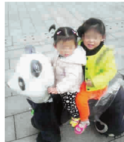
两名小女孩生前照片 图 TP

据新华社南昌9月24日专电(记者沈洋 胡晨欢 温美良)南昌市公安局24日中午表示,南昌市、新建县两级公安机关已经成立“9·21”事件调查组。警方24日已对“洗衣机绞死案”儿童的遗体进行了尸检,并对这台洗衣机进行载重试验。南昌市公安局称认定事件性质、下达结论尚需时间。